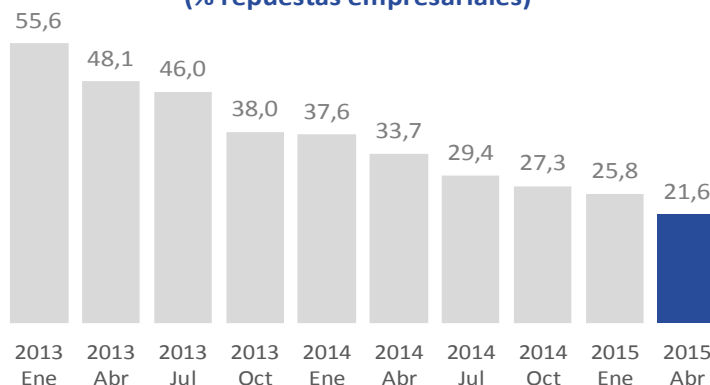
Evolución de las Expectativas Desfavorables (% repuestas empresariales)

Los empresarios de Tenerife son un 12% menos pesimistas que hace un año y un 27% menos que hace dos.