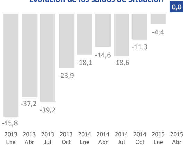
Evolución de los saldos de Situación